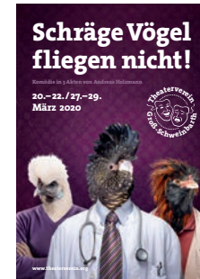
2020: (Coronaausfall) „Schräge Vögel fliegen nicht!“