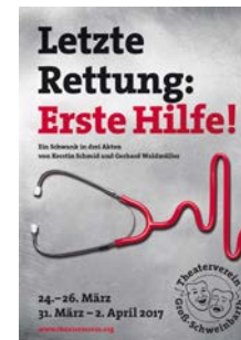
2017: „Letzte Rettung: Erste Hilfe!“