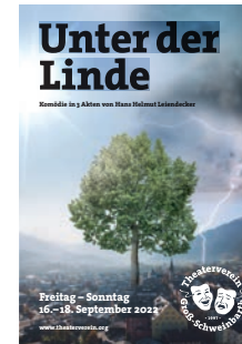
2022: „Unter der Linde“