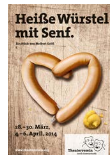
2014: „Heisse Würstel mit Senf“