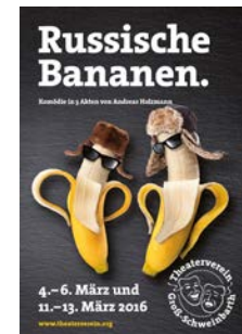
2016: „Russische Bananen“