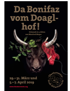
2019: „Da Bonifaz vom Doaglhof“