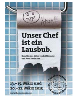
2015: „Unser Chef ist ein Lausbub“